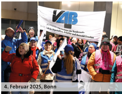
4. Februar 2025, Bonn