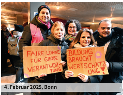
4. Februar 2025, Bonn