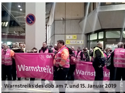
Warnstreiks des dbb am 7. und 15. Januar 2019