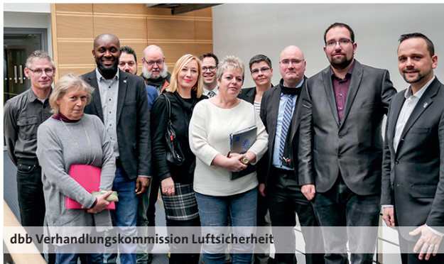
dbb Verhandlungskommission Luftsicherheit

Wir haben lange verhandelt, wir haben erfolgreich gestreikt, jetzt wird es Zeit, dass unsere gemeinsame Arbeit auch Früchte trägt. Deshalb hat der dbb am 12. April 2019 den ausgehandelten Tarifvertrag mit dem BDL (Bundesverband der Luftsicherheitsunternehmen) unterzeichnet. Die Verhandlungskommission aus komba- und VPS-Mitgliedern hat für die Annahme gestimmt. So ist sichergestellt, dass der erste Erhöhungsschritt für §5er ab dem 1. April 2019 und für